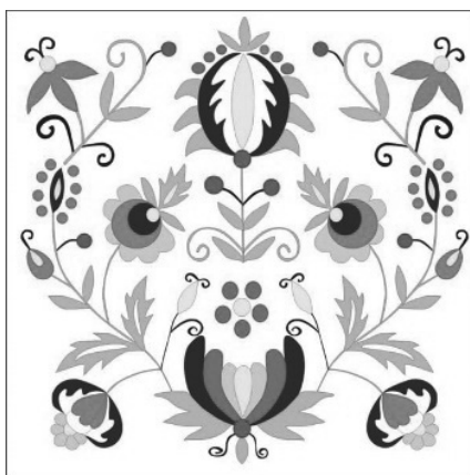
Figure 2. Kashubian embroidery

W celu weryfikacji rzeczywistej znajomości elementów materialnych kultury kaszubskiej ankietowanych zapytano, który z haftów jest kaszubskim. Na zdjęciach znajdowały się kolejno haft: kaszubski, łowicki oraz góralski. Badani, aż w 87%, niezależnie od płci, wybrali poprawną odpowiedź (rys. 1). Drugim pod względem wybieralności był haft łowicki, wskazywany przez co 10 ankietowanego. Wyniki badań własnych zgadzają się z wynikami innych autorów. Z badania przeprowadzonego przez Wojciechowską (2017) wynika, iż haft kaszubski rozpoznaje 85% ankietowanych.