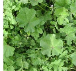
نبات "القرص عنه" الشائع في طرطوس

نبات الخبيزة من الأكلات الشعبية الشائعة في جنوب سورية