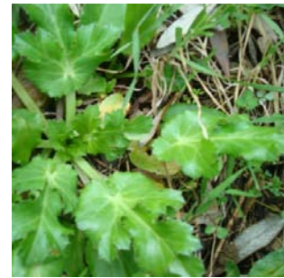
نبات الكاردي، يعتمد عليه أهالي ريف حلب في غذائهم ودوائهم